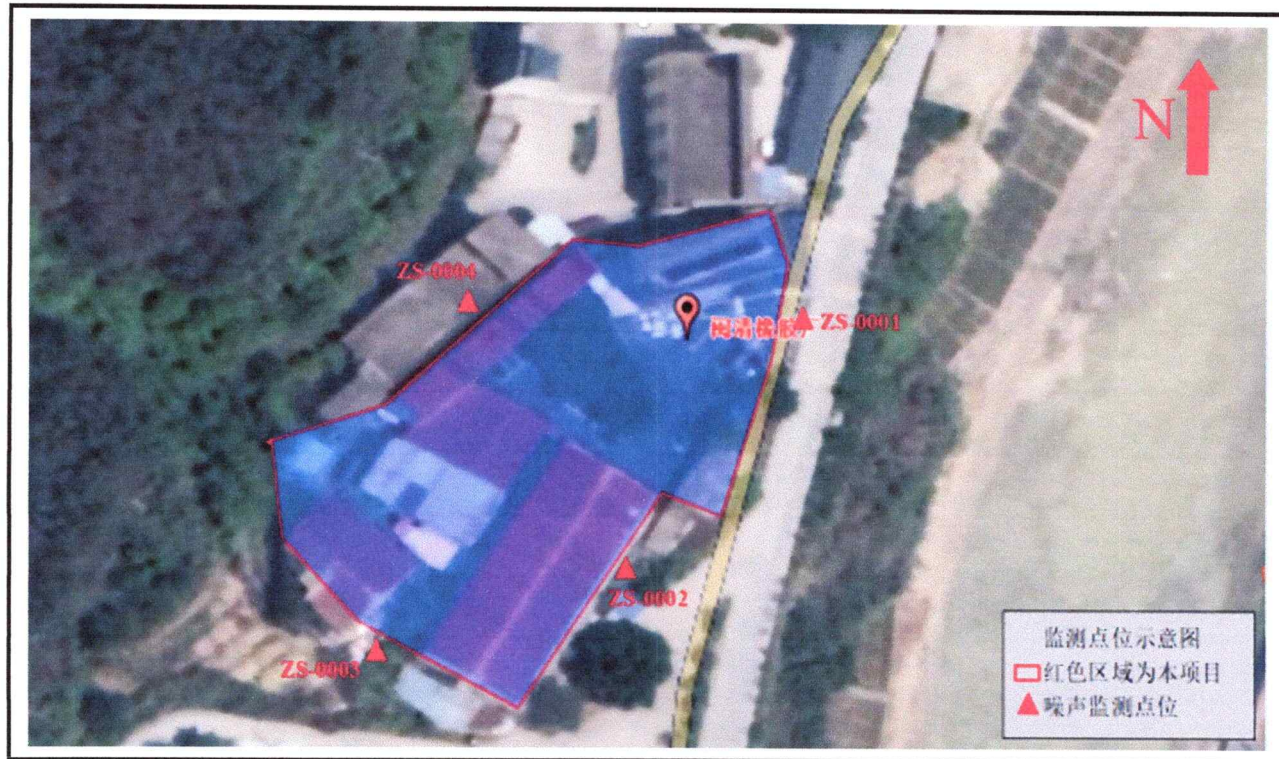
附图 1: 项目监测点位示意图