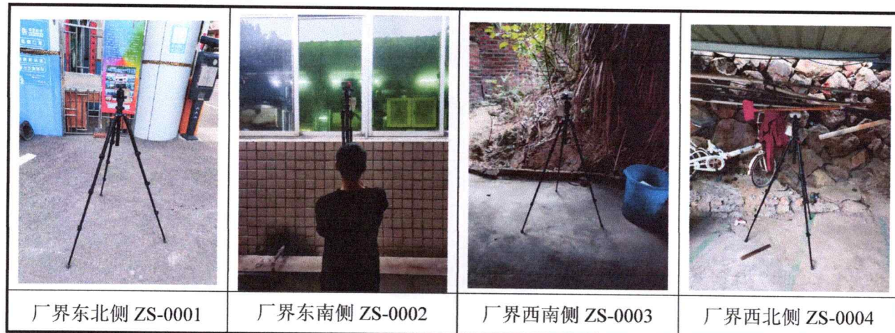
附图 2: 现场检测/采样照片

注: 1.本报告检测结果仅与被检样品有关, 如有疑问, 请于十五日内向本单位提出; 2.本报告及复印件未加盖本单位检测报告专用章无效, 未经本单位允许, 不得复制本报告。